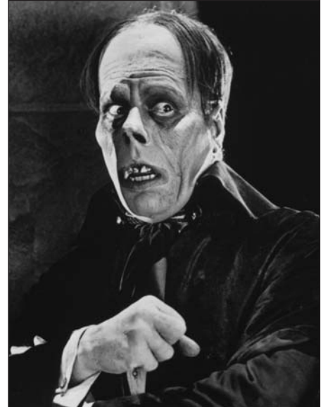
A Lon Chaney Sr. se le reconoce extensamente como el innovador más importante de las primeras etapas de efectos visuales de las películas. Ha podido transformarse en muchos personajes de fácil identificación que tienen alta resonancia después de muchas décadas. Chaney en un retrato de publicidad del estudio su apariencia en la vida real, como Quasimodo en THE HUNCHBACK OF NOTRE DAME (1923) y como El Fantasma en THE PHANTOM OF THE OPERA (1925).

Estudie algunas películas o libros con ilustraciones de criaturas de fantasía, monstruos, o maquillaje que indica la vejez. Escoja el tipo de maquillaje que quiere diseñar.