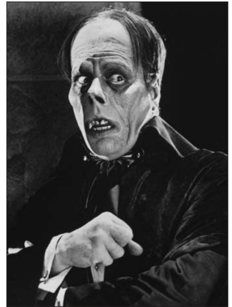
Lon Chaney Sr. is widely acknowledged as the most important early innovator of motion picture makeup effects; he transformed himself into many iconic characters that still resonate decades later. Chaney in a studio publicity portrait illustrating his real-life appearance, as Quasimodo in THE HUNCHBACK OF NOTRE DAME (1923), and as the Phantom in THE PHANTOM OF THE OPERA (1925).

Study some movies or books with pictures of fantasy creatures, monsters, or old-age makeup. Choose the type of makeup you want to design.